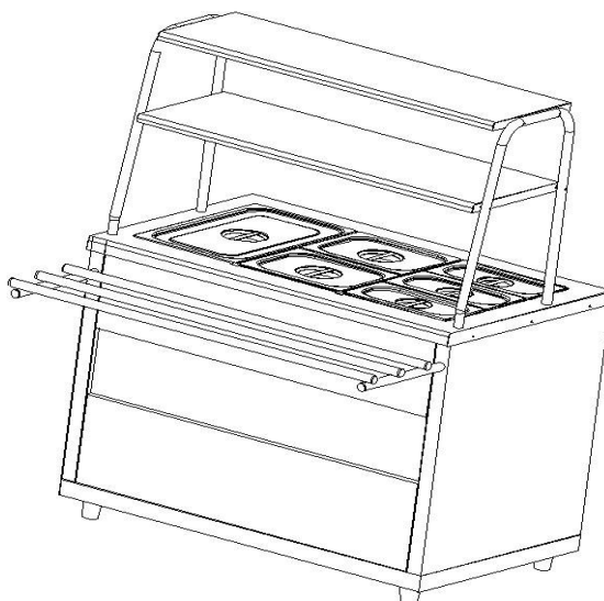
Рис.1 Общий вид мармита МЭП-2Б/ЛП-01 и МЭП-2Б/ЛПЭ

Общий вид мармита представлен на рис. 1. В серии «Ли́ра-Профи» корпус мармита изготовлен из нержавеющей стали, в серии «Ли́ра-Профи Э́ко» отдельные элементы изготовлены из окрашенной оцинкованной стали. В столешницу мармита встроена прямоугольная ванна с электронагревательными элементами.