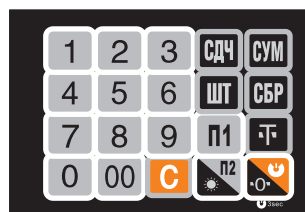
Рис. 3. Клавиатура